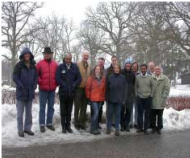
El Grupo de Trabajo en el Centro de conferencias de Sanga-Saby c en Estocolmo, Suecia

Los miembros del grupo de trabajo no adoptaron posturas sobre ninguno de los temas discutidos en la primera reunión. Ellos estarán trabajando entre reuniones para consultar a los grupos de interesados y asegurar que todos los temas sean atendidos durante la revisión y sean informados sobre las cuestiones.